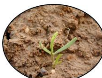
Renouée des Oiseaux