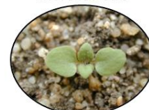
Véronique de Perse