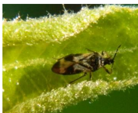
Anthocoris sp. Taille : 5 mm