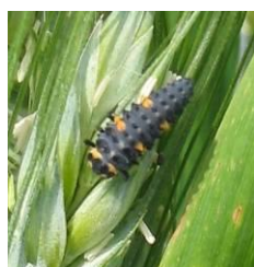
Larve de coccinelle Taille : 10 mm