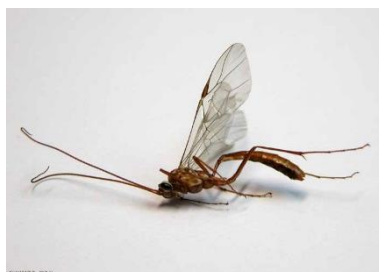
Ichneumonidae (super famille Ichneumonoidea) 2 à 27 mm