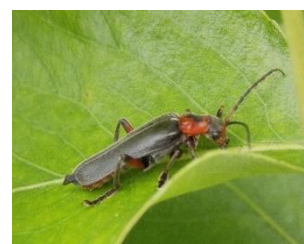
Cantharide Taille : 10 à 12 mm