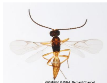
Braconidae (super famille Ichneumonoidea) 1 à 10 mm