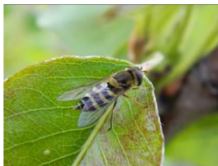
Syrphe sp. Taille : de 10 à 15 mm