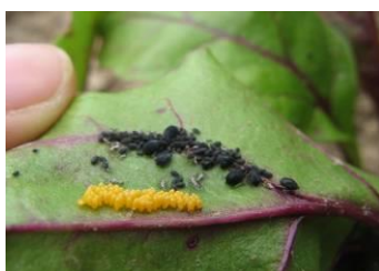
Œufs de coccinelle