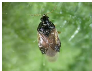
Orius sp. Taille : 2,5 mm