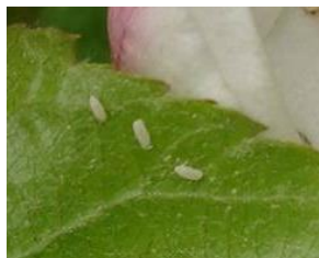
Œufs de syrphe Taille : 1 mm