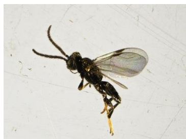
Chalcidoidea Petit à minuscule