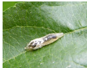
Larve de syrphe