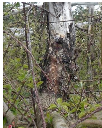
Chancre à nectria sur tronc

Le chancre à Nectria ou chancre européen est à l'origine de dégâts parfois importants dans certaines parcelles où il provoque des mortalités de rameaux ou de charpentières. La maladie est particulièrement nuisible pour les jeunes arbres en formation. Au printemps, le dessèchement brutal des inflorescences et des jeunes rameaux issus de lambourdes est caractéristique de la maladie. Elle occasionne aussi très souvent des pourritures sèches au niveau de l'œil et du pédoncule sur fruits.