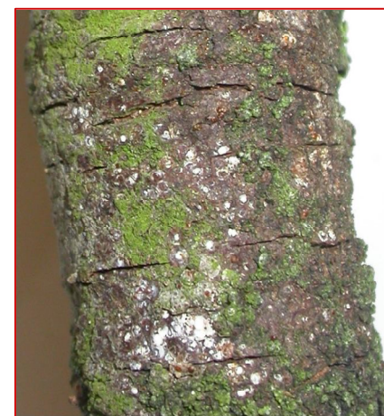
Cochenille rouge du poirier encroûtement sur rameaux et fente de l'écorce

En présence de dessèchement de rameaux, rechercher sur les écorces la présence de cochenilles et d'encroûtement.