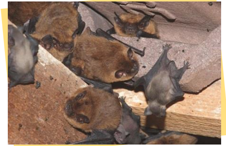
Pipistrelles communes photo muséum de Bourges

Mammifères singuliers, les chauves-souris (ou chiroptères) prennent le relais des oiseaux insectivores et exploitent la niche écologique des insectes crépusculaires et nocturnes, au moyen de leur sonar sophistiqué. Elles émettent des cris très aigus qui leur sont renvoyés en écho par les obstacles qui se trouvent sur leur chemin.