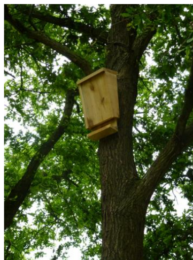
Nichoir à chauve souris photo A. Mallet ca37

Rédacteur : groupe PRDA Biodiversité (conseillers biodiversité des Chambres d'Agriculture de la Région Centre Val de Loire)