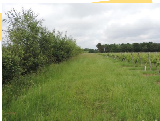
Aménagement en bordure de vignes Photo E. Bollotte ca37