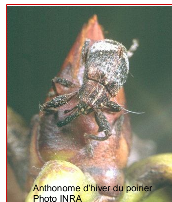
Anthomome d'hiver du poirier