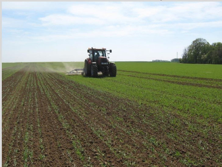
Passage de herse étrille sur du blé en post-levée à la Ferme de La Saussaye

En revanche, en pois chiche, son passage a donné satisfaction. En effet, sur cette culture, il n'existe pas de solution chimique de rattrapage. Le pois chiche est, en début de cycle, lent à s'installer et peu couvrant. La présence de lumière favorise le développement des adventices qui sont passées au travers du programme chimique de prélevée. Deux années de suite, un passage en post-levée entre 3 et 6 feuilles du pois chiche a permis d'éliminer des gaillets, atriplex, renouées persicaires et renouées des oiseaux faiblement développés.