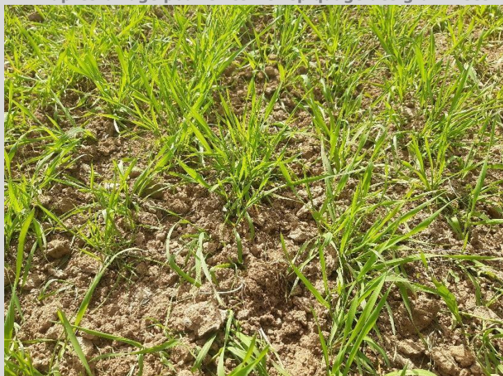
Ferme de La Saussaye, système autonome, après passage de la bineuse. Des conditions sèches sont nécessaires après binage pour éviter le repiquage des graminées

En fin de printemps, le désherbage de la parcelle était jugé satisfaisant par l'expérimentatrice vis-à-vis des graminées (moins de 1 vulpin/m 2 en moyenne), et insatisfaisant (mais attendu au vu des leviers mobilisés) vis-à-vis des chardons (plus de 5 chardons/m 2 en moyenne sur l'ensemble de la parcelle).