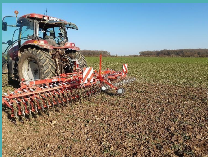
Roto-étrille, Ferme de La Saussaye

Pour voir la roto étrille en action sur une parcelle bio de La Saussaye : https://twitter.com/i/status/1367139763694804992