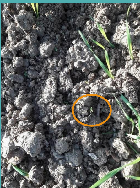
Passage de bineuse faible écartement sur lin de printemps à la Ferme de La Miermagne

Binage sur céréales réalisés à Miermagne en novembre 2020 : le sol frais et la présence de grosse rosée ont provoqué le repiquage des adventices arrachées et formation de petites mottes.