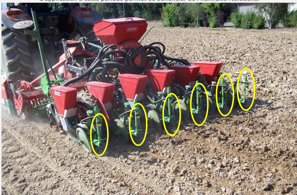
Pulvérisation sur le rang au moment du semis du colza à Miermagne. L'application à cette période permet de bénéficier de l'humidité résiduelle.

En pratique, l'herbicide est appliqué au moment du semis au moyen d'une buse (angle 40°, pression de pulvérisation 2 bars, volume de bouille appliquée sur le rang 130 L/ha 3 ) située à l'arrière de la roulette de ré-appui. La présence d'humidité résiduelle, liée à l'application au moment du semis est un facteur primordial à la mise en solution des matières actives. Elle garantit l'efficacité des produits à action racinaire. L'inter-rang est géré uniquement mécaniquement en post-levée de la culture. La bineuse est équipée de socs travaillants chacun sur une largeur de 15 cm. Pour un inter-rang de 50 cm, 3 socs à patte d'oie (à Miermagne) ou dents Lelièvre (à la Saussaye) gèrent l'inter-rang. La vitesse d'avancement est de 4 à 10 km/h selon les cultures avec une profondeur de travail de 3-4 cm.