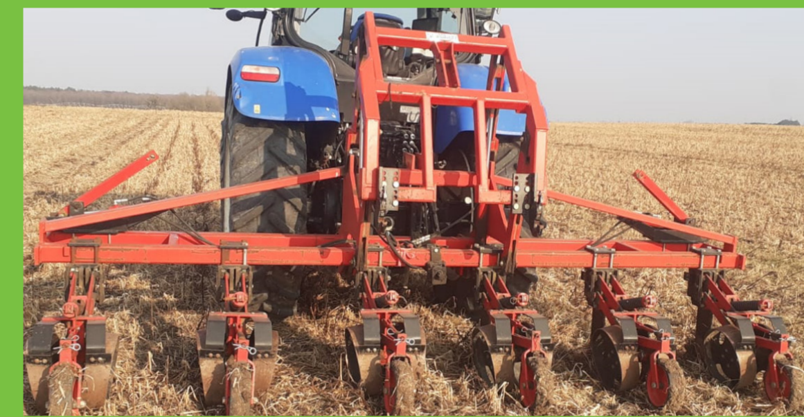
Du semis au strip-till de la féverole ....

« Après une première année d'essai concluante du semis de mon couvert multi-espèces dont la féverole au strip-till sur le futur rang de maïs, tous mes couverts précédents maïs sont réalisés ainsi. Je cherche désormais à optimiser l'implantation de ce couvert multi-espèces pour réduire les coûts de mécanisation et le temps passé. »