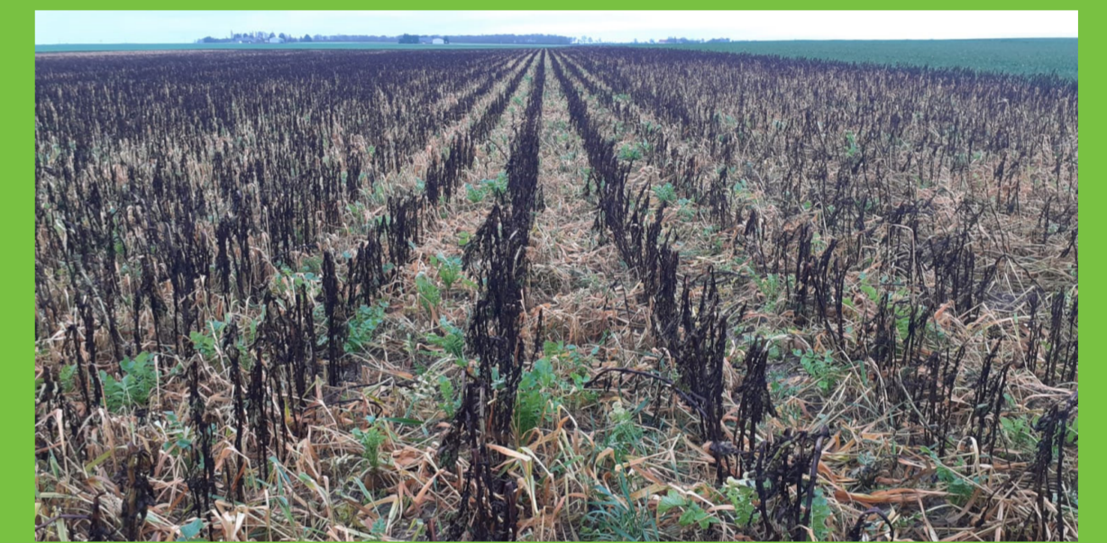
À la destruction quasi-totale par le gel (-9°C) début janvier.