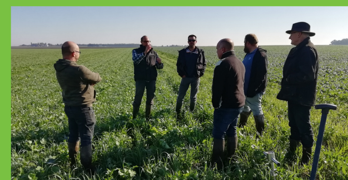
Rallye des couverts à l'automne 2021 !