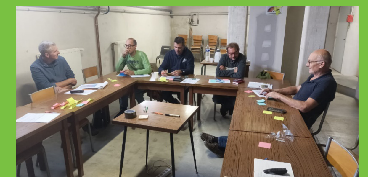
Bilan IFT et préparation de la journée des groupes innovants.