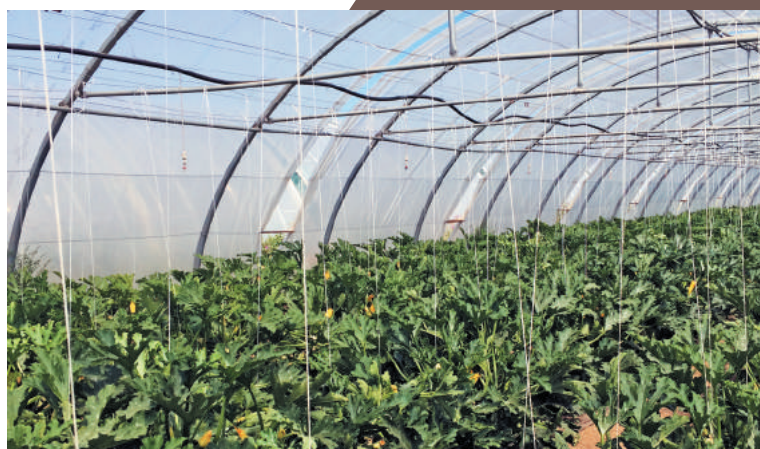
▲ Essai courgette