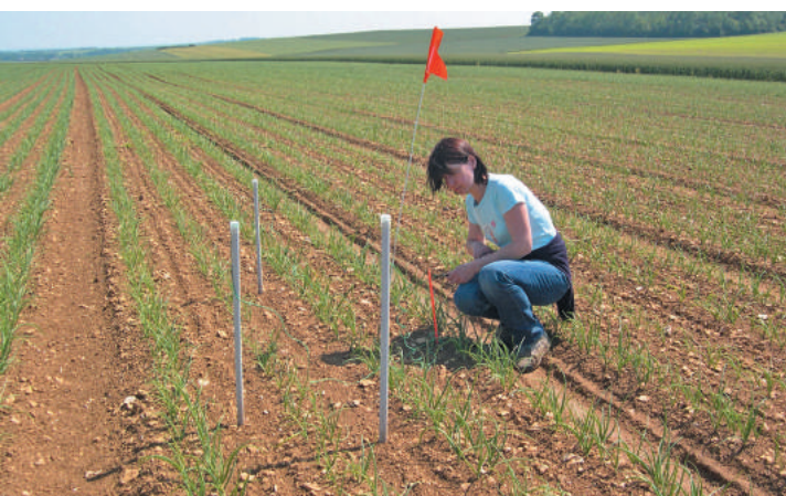
▲ Suivi et pilotage d'irrigation dans une parcelle d'oignons