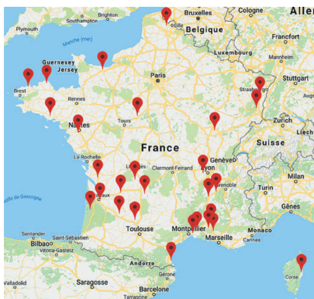
Carte des dispositifs expérimentaux en légumes associés et/ou partenaires avec le réseau des Chambres d'agriculture.

https://chambres-agriculture.fr/recherche-innovation/experimentation/sites-dexperimentation/