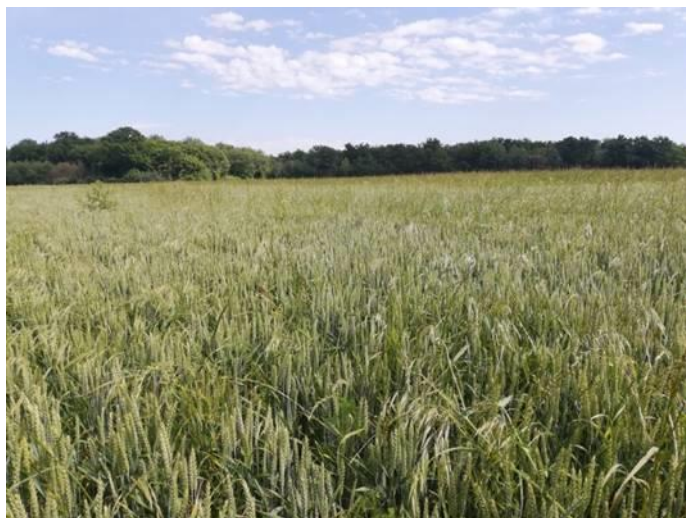
Parcelle de blé infestée de graminées (ray grass et brome)

Quels diagnostics et quels leviers possibles pour diminuer la pression graminées dans la rotation ?